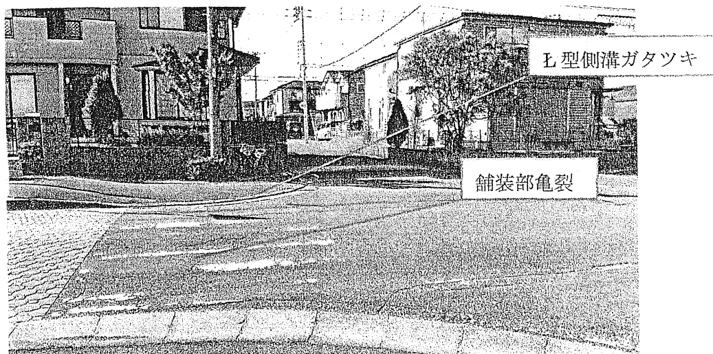
①横断歩道舗装部亀裂（白線不明、E型側溝ガタツキ）